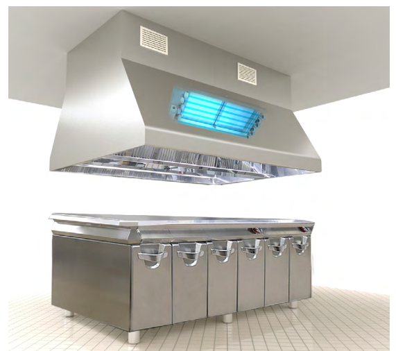
Applicazione in una cucina industriale

La tecnologia UV-C è un metodo di disinfezione fisico con un ottimo rapporto costi/benefici, è ecologico e, al contrario degli agenti chimici, funziona contro tutti i microrganismi senza creare resistenze.